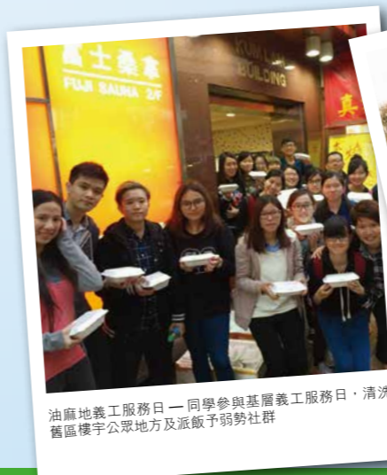
油麻地義工服務日 - 同學參與基層義工服務日，清洗舊區樓宇公眾地方及派飯予弱勢社群