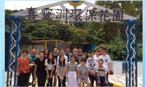
參與懲教署舉辦的「綠島計劃」,探訪喜靈洲懲教所。

畢業後,你可選擇升讀與社會政策、社會行政、社會服務管理或政治學相關的學士學位課程,例如香港理工大學社會政策及行政(榮譽)文學士學位課程及香港中文大學政治與行政學社會科學學士學位課程。