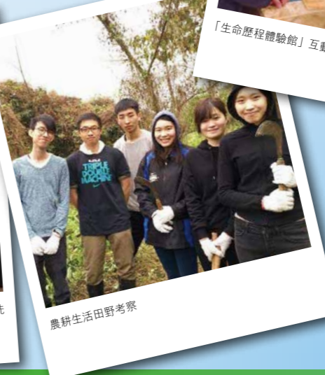
農耕生活田野考察