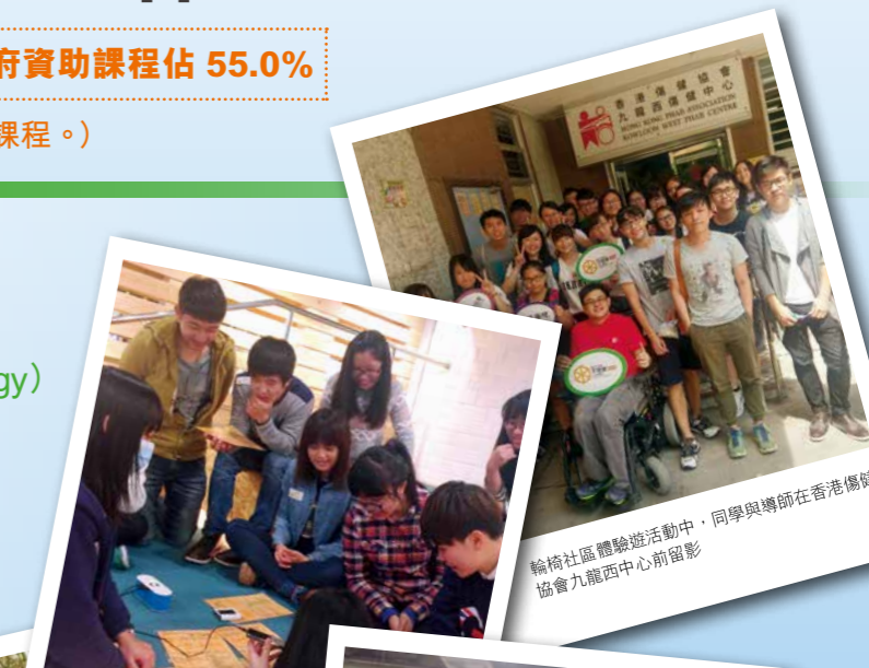
輪椅社區體驗遊活動中，同學與導師在香港傷健協會九龍西中心前留影