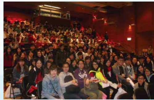
長者社區服務計劃活動中,同學正準備出發為旺角區內獨居長者進行家居清潔。

假如你有志升學,本地大學提供逾 30 個相關的學士學位課程供你選擇,例如香港大學社會科學學士學位課程及香港中文大學教育學士(通識教育)學位課程。