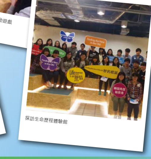
探訪生命歷程體驗館