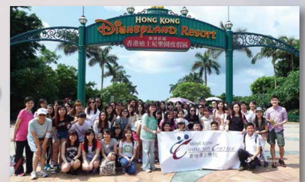
迪士尼工作體驗坊